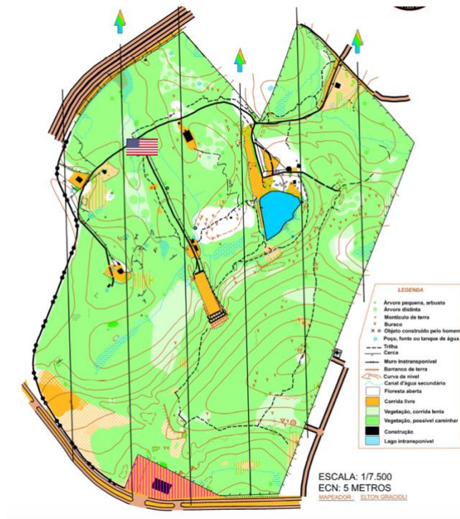
SNAKE AIRSOFT FIELD (S.A.F)

7. Os EUA mantem uma base quase nos limites entre Vietnã do Norte e Vietnã do Sul, é dela que saí diversos destacamentos para buscar, encontrar e destruir bases dos Vietcongues.