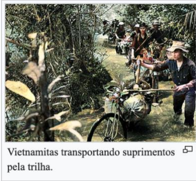
Vietnamitas transportando suprimentos pela trilha.

6. Os Vietcongues, ou comunistas vietnamitas, eram o braço militar da Frente de Libertação Nacional (NLF) e eram comandados pelo Escritório Central do Vietnã do Sul, localizado próximo à fronteira com o Camboja. Para armas, munições e equipamentos especiais , os vietcongues dependiam da trilha de Ho Chi Minh . Outras necessidades foram atendidas dentro do Vietnã do Sul.